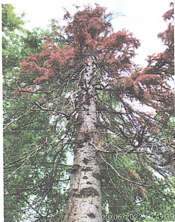
Фото аварийных деревьев