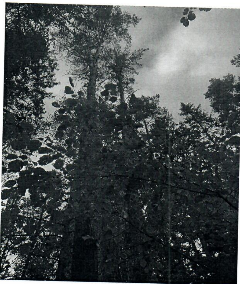
Фото аварийных деревьев