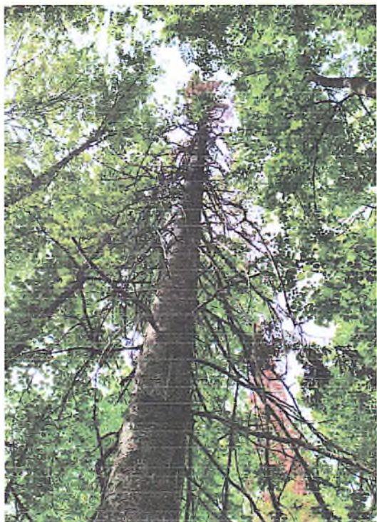
Фото аварийных деревьев