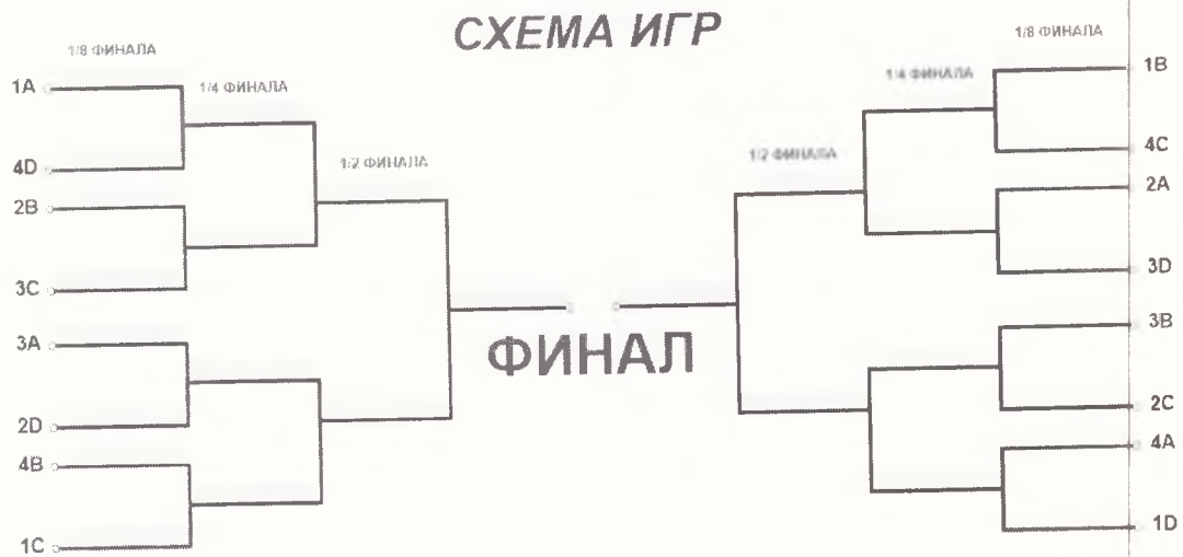
СХЕМА проведения игр плей-офф III этапа Соревнований